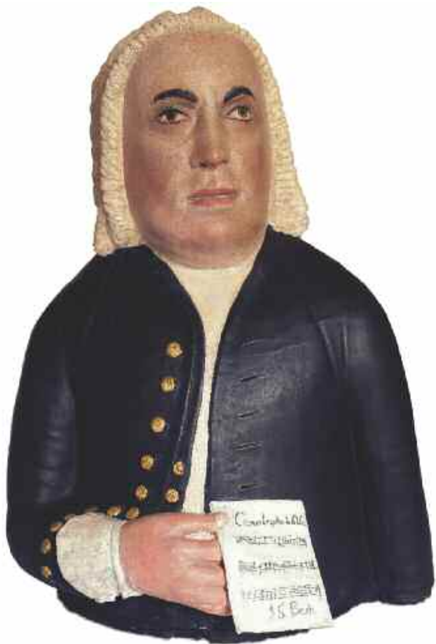
Giuseppe Gavazzi, Busto di Johann Sebastian Bach , 2012, terracotta policroma, cm 75 x 50 x 40